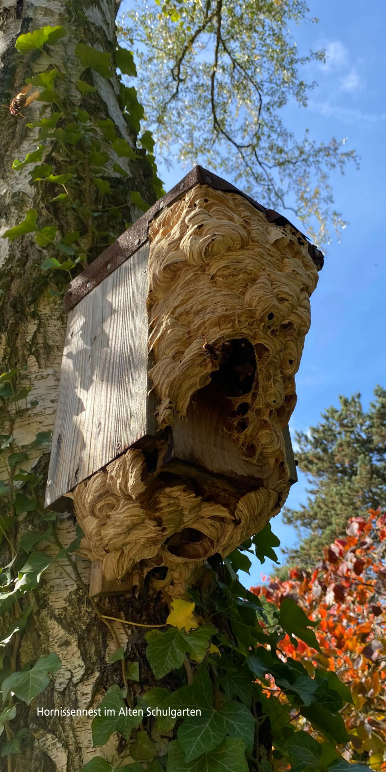
Hornissennest im Alten Schulgarten