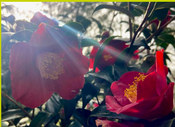
Camellia spec. im Teegarten

Botanischer Garten Rombergpark Am Rombergpark 35 a, 44225 Dortmund Tel. (0231) 50-2 41 64 Fax: (0231) 50-2 41 63 botanischer-garten@dortmund.de www.rombergpark.dortmund.de